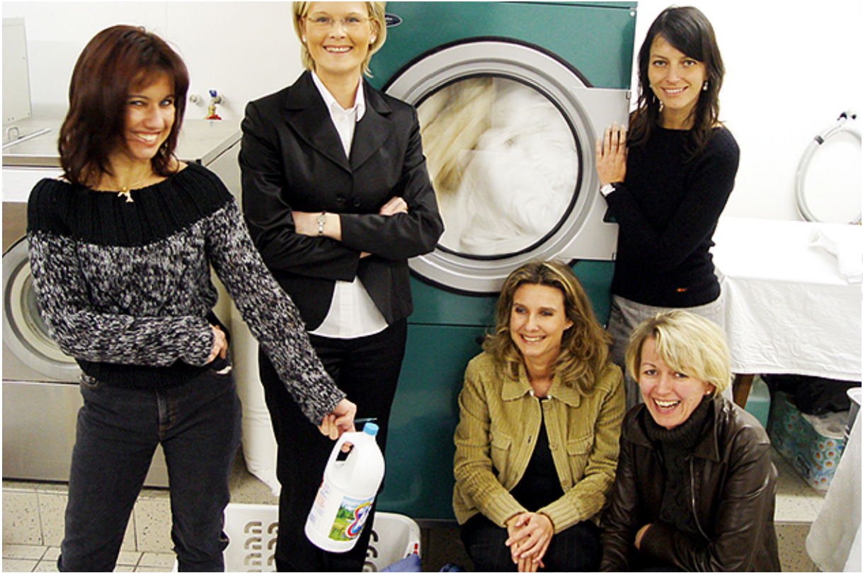
Lachen in jeder Lebenslage!