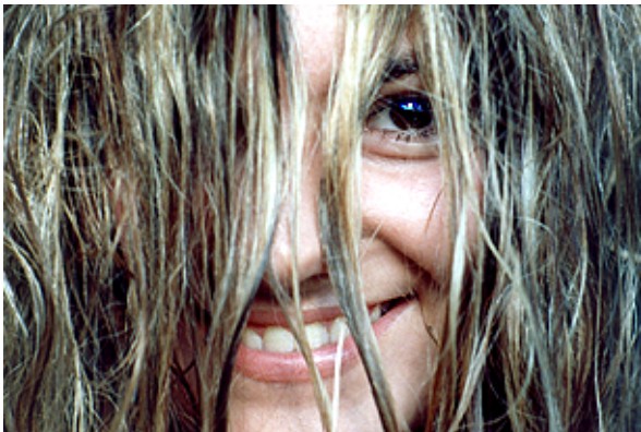
Morgenfragen – z.B. beim Kämmen