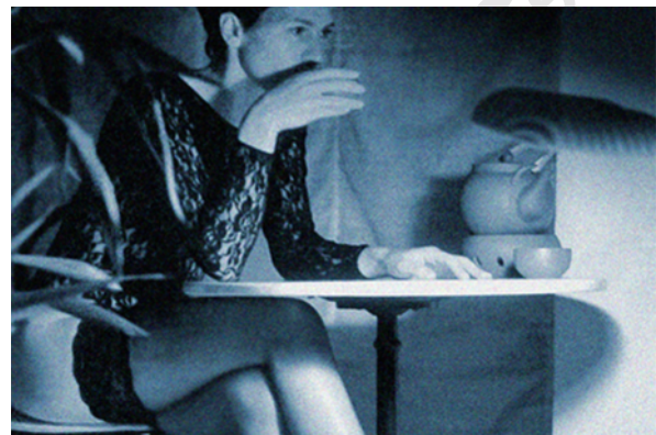
Abendfragen – z.B. beim Abendtee