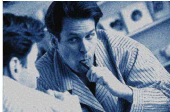
Abendfragen – z.B. beim Zähneputzen