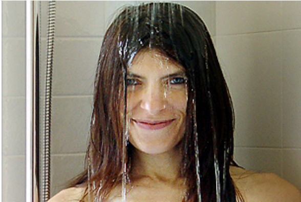
Morgenfragen – z.B. in der Dusche